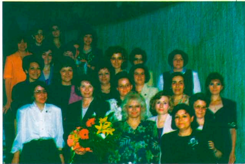
Учредителите на Вътрешния кръг в Пловдив

Международният вътрешен кръг свързва членове на клубове в страни от Европа до Африка, Индия, Филипините, Австралия, Нова Зеландия, Съединените щати и Канада и др. Членовете могат да общуват един с друг посредством кореспонденция, обменни посещения и като участват заедно в международни проекти. Президентски обиколки обличават членовете, като научават за дейностите на Вътрешния кръг в най-различни територии. Клубовете предоставят услуги както в своята общност, така и из-